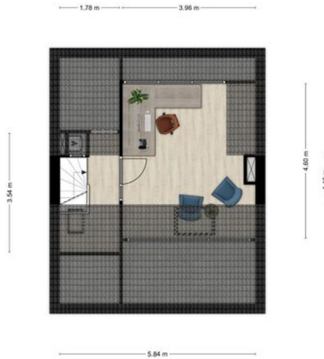
Pastoor van der Marckstraat 20 te Weurt Tweede Verdieping

Aan de plattegronden kunnen geen rechten worden ontleend. © Tekeningen Vastgoedpresentatie