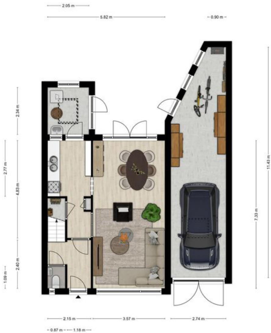
Pastoor van der Marckstraat 20 te Weurt Begane grond

Aan de plattegronden kunnen geen rechten worden ontleend.